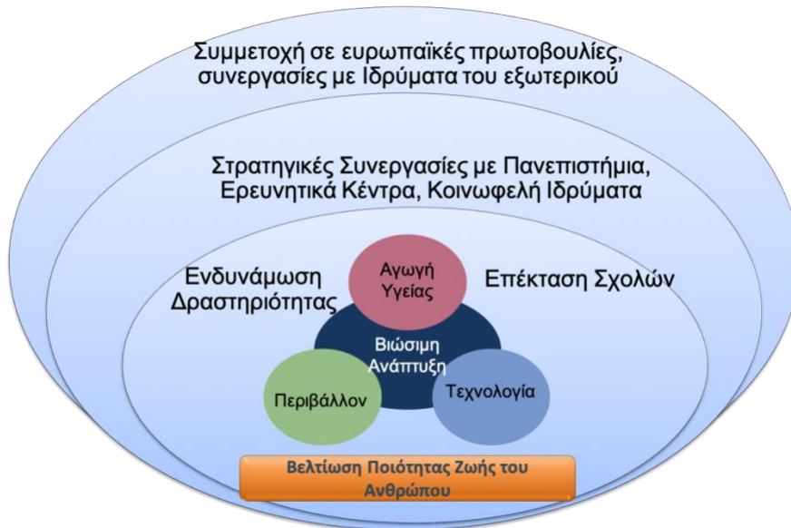
Σχήμα 2: Οπτική Ανάπτυξης του Πανεπιστημίου

Η περαιτέρω ανάπτυξη του Πανεπιστημίου είναι απαραίτητη για την εμπέδωση του ως ένα εξωστρεφές εκπαιδευτικό και ερευνητικό κέντρο υψηλής αριστείας σε ότι αφορά τη βελτίωση της ποιότητας ζωής. Πέρα από την ενδυνάμωση των δραστηριοτήτων του η ανάπτυξη αυτή θα πρέπει να περιλαμβάνει και την επέκταση των προγραμμάτων σπουδών των Σχολών του. Στην προσπάθεια αυτή σημαντικό ρόλο παίζουν στρατηγικές συνεργασίες σε εθνικό και διεθνές επίπεδο αλλά και η δημιουργία νέων Τμημάτων (σχήμα 2).