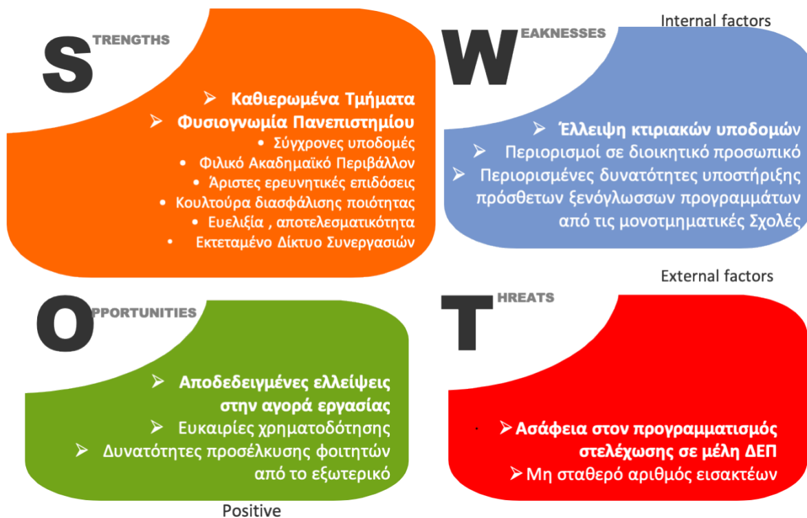
Σχήμα 3: Ίδρυση νέων Τμημάτων - Ανάλυση SWOT

υπαρχόντων συνεργασιών, υπό την προϋπόθεση ότι θα έχουν γνωστικά αντικείμενα συγγενή με τα ήδη υπάρχοντα Τμήματα.