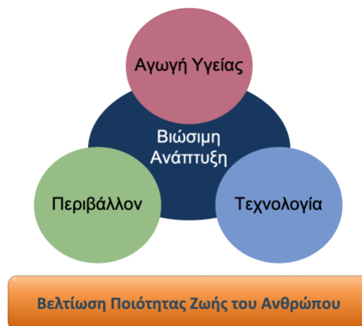
Σχήμα 1: Στόχος και επιστημονικές περιοχές που θεραπεύονται

Το Πανεπιστήμιο έχει διαρθρωθεί σε 3 Σχολές, που θεραπεύουν επιστημονικές περιοχές αιχμής, εναρμονισμένες πλήρως με την αναπτυξιακή πολιτική της Ευρωπαϊκής Ένωσης για την επόμενη περίοδο, που επικεντρώνεται στην πράσινη μετάβαση και τη βιώσιμη ανάπτυξη (Σχολή Περιβάλλοντος, Γεωγραφίας και Εφαρμοσμένων Οικονομικών), στην ψηφιακή τεχνολογία και δεξιότητες (Σχολή Ψηφιακής Τεχνολογίας) και στην προαγωγή της υγείας (Σχολή Επιστημών Υγείας και Αγωγής). Η περαιτέρω εξέλιξη σε καθεμιά από αυτές και ο συγκερασμός τους με την υποστήριξη διεπιστημονικών πεδίων συνδράμει καθοριστικά στην επίτευξη βιώσιμης ανάπτυξης, κυρίαρχο παράγοντα στην διασφάλιση και βελτίωση της ποιότητας ζωής του ανθρώπου και την ευημερία της κοινωνίας (βλέπε σχήμα 1). Επομένως, είναι καθοριστικής σημασίας να συνεχίσει να επικεντρώνει τις εκπαιδευτικές και ερευνητικές προσπάθειές του στις περιοχές αυτές. Συνεπώς, θα πρέπει να ενισχύσει τις υπάρχουσες Σχολές του με νέα Τμήματα και προγράμματα σπουδών, τόσο προπτυχιακά όσο και μεταπτυχιακά, ξενόγλωσσα και μη.