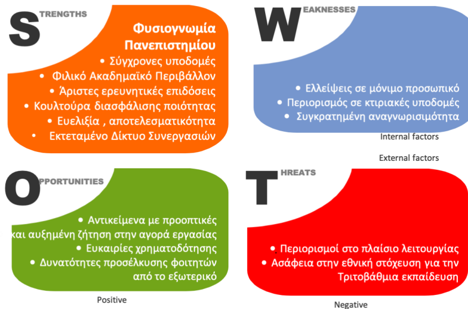
Σχήμα 2. Στρατηγική ανάπτυξης - Ανάλυση εφικτότητας (SWOT)