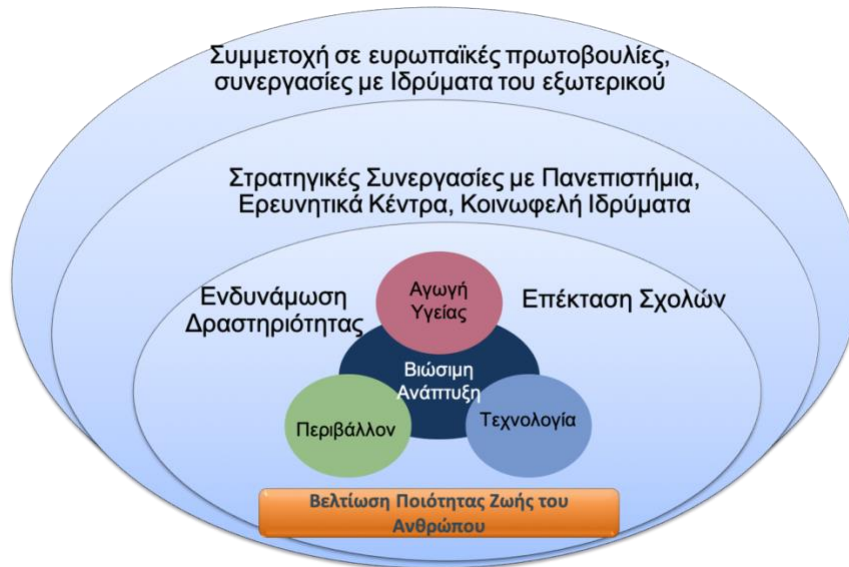
Σχήμα 4: Οπτική Ανάπτυξης του Πανεπιστημίου

Συνοψίζοντας, η περαιτέρω ανάπτυξη του Πανεπιστημίου είναι απαραίτητη για την εμπέδωση του ως ένα εξωστρεφές εκπαιδευτικό και ερευνητικό κέντρο υψηλής αριστείας σε ότι αφορά τη βελτίωση της ποιότητας ζωής. Πέρα από την ενδυνάμωση των δραστηριοτήτων του η ανάπτυξη αυτή θα πρέπει να περιλαμβάνει και την επέκταση των προγραμμάτων σπουδών των Σχολών του. Στην προσπάθεια αυτή σημαντικό ρόλο παίζουν στρατηγικές συνεργασίες σε εθνικό και διεθνές επίπεδο αλλά και η δημιουργία νέων Τμημάτων (σχήμα 4).